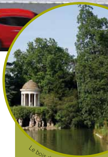
Le bois de Vincennes

À deux pas, le centre-ville et ses nombreux commerces, le cinéma Royal Palace, le marché central, la base nautique du port de Nogent, les écoles... tout est réuni dans un périmètre assez proche pour vous assurer un quotidien aussi pratique qu'agréable.