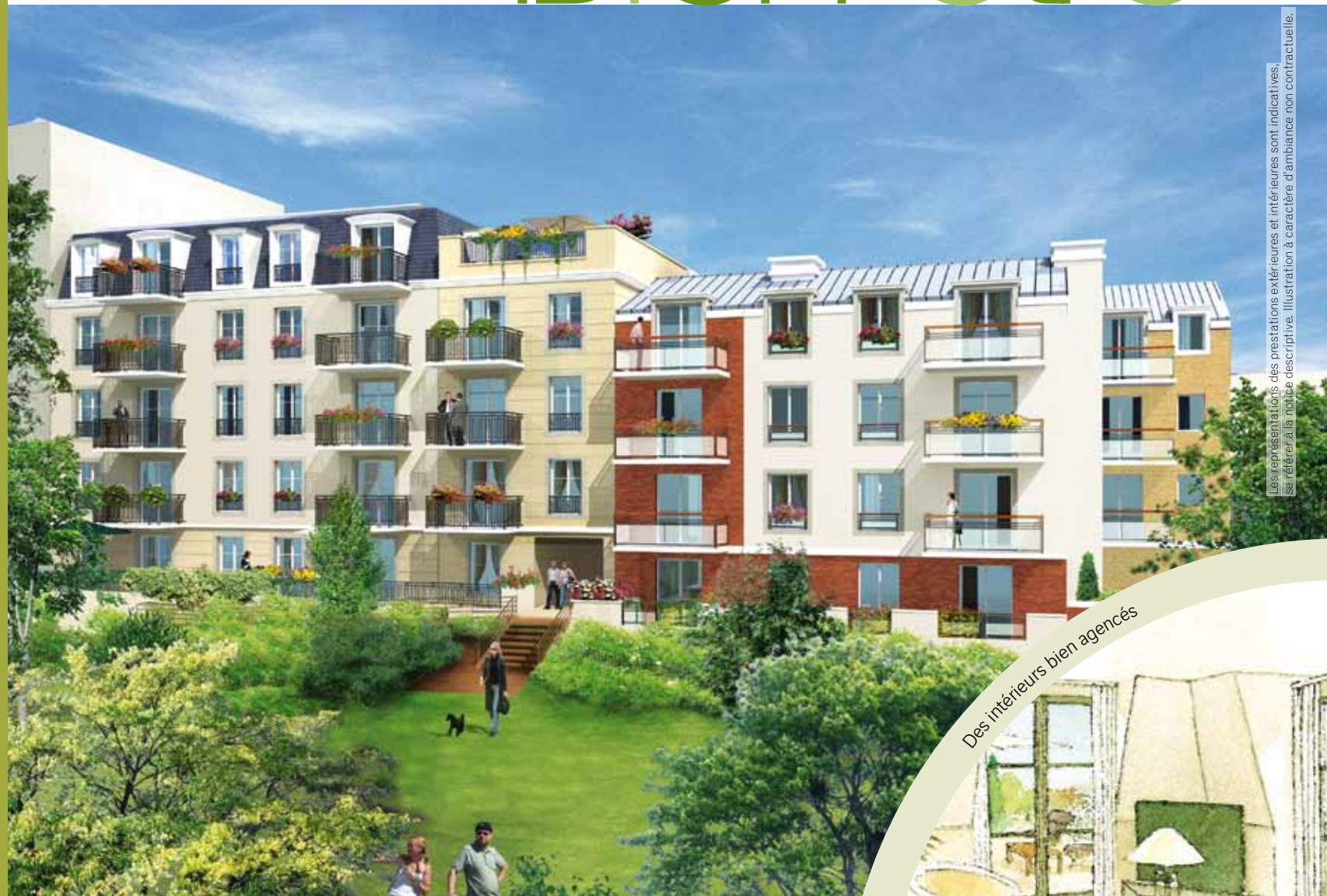
Vue de la résidence depuis le jardin

S'articulant autour de deux bâtiments à la hauteur volontairement maîtrisée (3 et 4 étages), "Jardin d'Opale" propose 35 appartements du studio au 5 pièces-terrasse aux prestations haut de gamme et dotés pour la plupart d'un balcon ou d'une terrasse. Côté sud, la façade largement ponctuée de baies vitrées, vous offre la vue sur un magnifique jardin arboré et paysager, entretenu par la ville.