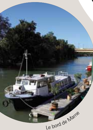
Le bord de Marne