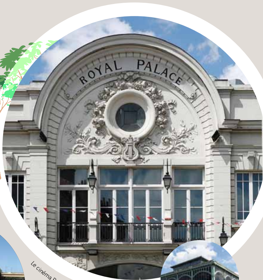
Le cinéma Royal Palace à 300 m de la résidence