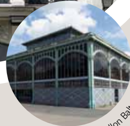
Le Pavillon Baltard