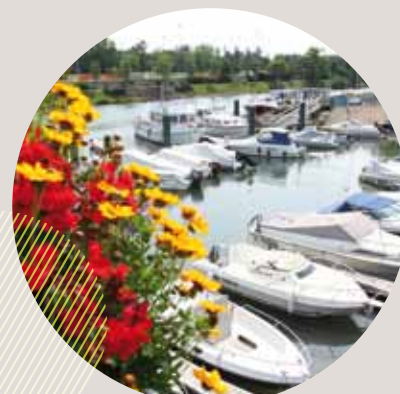
Le port de plaisance