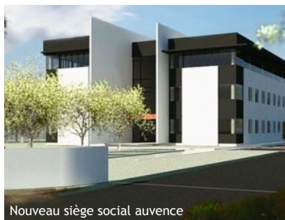
Nouveau siège social auvence